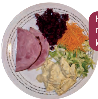
Heisser Schinken mit Salat Fr. 18.- kl. Portion Fr. 15.-

Am Sonntagnachmittag, nach dem Konzert/Theater