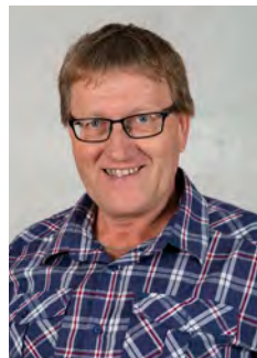
Regie und Bühne: Werner Stadelmann